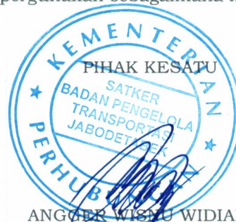
ANGGER WISNU WIDIANTO